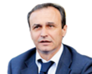
Паскуале Марино Главный тренер ФК «Пескара», Италия

«... Отличаются организованностью и всегда учитывают особые пожелания тренерского штаба...»